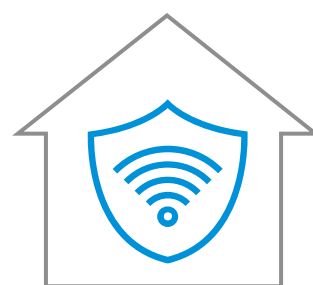
SOFTWARE E HARDWARE PER LA CYBER SECURITY