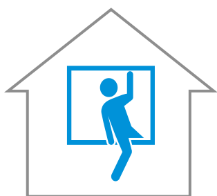
PREVENZIONE INTRUSIONE E FURTO

Fiera del Levante, Bari 22-23 novembre 2018